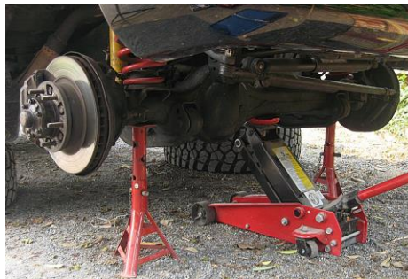
ภาพที่ 2 ความปลอดภัยเกี่ยวกับงานช่างยนต์

2.1.8 ในการบริการใด ๆ ใต้ท้องรถจะต้องมีขาตั้งรองรับรถในตำแหน่งที่แข็งแรง