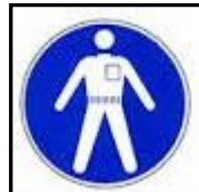
โปรตแต่งกายรัดกุม