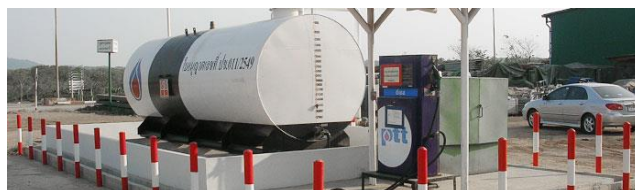
ภาพที่ 4 ความปลอดภัยเกี่ยวกับน้ำมันเชื้อเพลิง