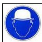
โปรตสวมหมวกนิรภัย