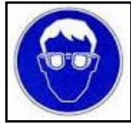
โปรตสวมแว่นตา

3.1.4 การปลูกจิตสำนึก ให้มีการติดป้ายเตือนความปลอดภัย เป็นอุปกรณ์ช่วยเตือนสติผู้ปฏิบัติงาน หรือผู้เกี่ยวข้องรับรู้ เพื่อป้องกันความเสี่ยงต่ออุบัติเหตุ และระมัดระวังเป็นพิเศษ