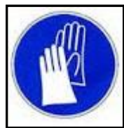
โปรตใส่ถุงมือ