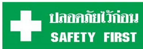
ภาพที่ 1 สัญลักษณ์ความปลอดภัย

1.1 ความปลอดภัย หมายถึง การปฏิบัติงานหรือการกระทำใด ๆ ที่ปราศจากการเกิดอุบัติเหตุ อันตราย ไม่เกิดความเสียหายต่อองค์ประกอบของระบบการทำงาน ตลอดระยะเวลาการปฏิบัติงาน ซึ่งช่วยให้การดำเนินกิจการนั้นไปในทางบวก เพิ่มการพัฒนาและเจริญก้าวหน้าขึ้น ทำให้เศรษฐกิจขยายตัว ยกระดับรายได้ ตลอดถึงความเป็นอยู่ของผู้คนในถิ่นนั้นดีขึ้น ดังภาพที่ 1