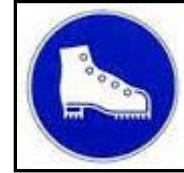
โปรตใส่รองเท้านิรภัย