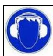
โปรตสวมที่ครอบหู