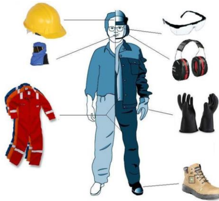
ภาพที่ 5 อุปกรณ์เกี่ยวกับการแต่งกายในการปฏิบัติงาน

3.1.1 กฎระเบียบเกี่ยวกับการแต่งกายต้องรัดกุมเหมาะสมกับสภาพงาน ในสถานประกอบการ