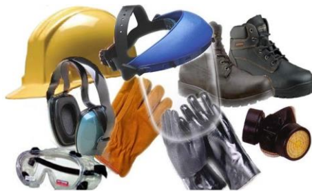
ภาพที่ 6 อุปกรณ์ป้องกันอันตรายในการทำงาน

3.1.2 ข้อบังคับเกี่ยวกับการใช้เครื่องมือเพื่อช่วยป้องกันอันตรายที่อาจเกิดขึ้น ต้องมีความพร้อมใช้งาน